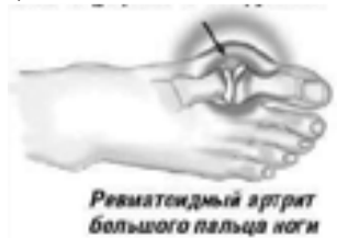
Ревматоидный артрит большого пальца ноги

Названия дистрофических болезней суставов заканчиваются на «-оз» – артроз, остеохондроз. Суть болезни – медленная дегенерация и разрушение внутрисуставного хряща. С течением времени происходит перестройка суставных концов костей и воспаление около-суставных тканей.